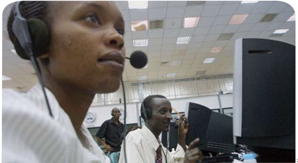
Centro de llamadas en Nairobi, Kenya: La turbulencia reciente agudiza el riesgo de que disminuya el flujo de recursos hacia África, según las últimas proyecciones del FMI sobre África subsahariana.

En los países exportadores de petróleo, se prevé una reducción temporal del crecimiento en medio punto porcentual, al 8% en 2008, debido principalmente al descenso más pronunciado de lo previsto de la producción de petróleo en el Delta del Níger como consecuencia de la persistente violencia en esta zona; la disminución ligeramente mayor de lo previsto de la producción de petróleo del principal yacimiento de pronta maduración en Guinea Ecuatorial, y la desaceleración del crecimiento no relacionado con el petróleo en Chad. En los países importadores de petróleo también se proyecta una desaceleración del crecimiento, de medio punto porcentual, al 5%.