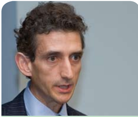
Milesi-Ferretti: El análisis de los tipos de cambio que hace el FMI tiene una perspectiva multilateral.

Ostry: Hay que tener en cuenta no solo las estimaciones del GCTC y otras metodologías adaptadas a las circunstancias del país, sino una evaluación más general que busca determinar si el nivel del tipo de cambio y las políticas que lo acompañan pueden poner en peligro la estabilidad externa. En pocas palabras, la inestabilidad externa representa el riesgo de movimientos repentinos y perturbadores de las corrientes de