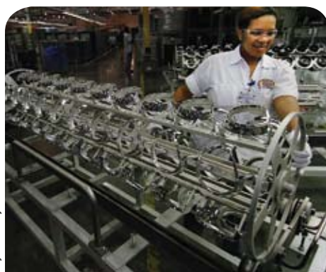
La turbulencia financiera está afectando a empresas que, si bien resistieron el encarecimiento del petróleo, hoy tienen mucha menos demanda.