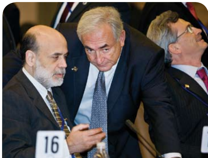
Ben Bernanke (izq.), Presidente de la Reserva Federal estadounidense, y Dominique Strauss-Kahn, Director Gerente del FMI, en la reunión del CMFI.