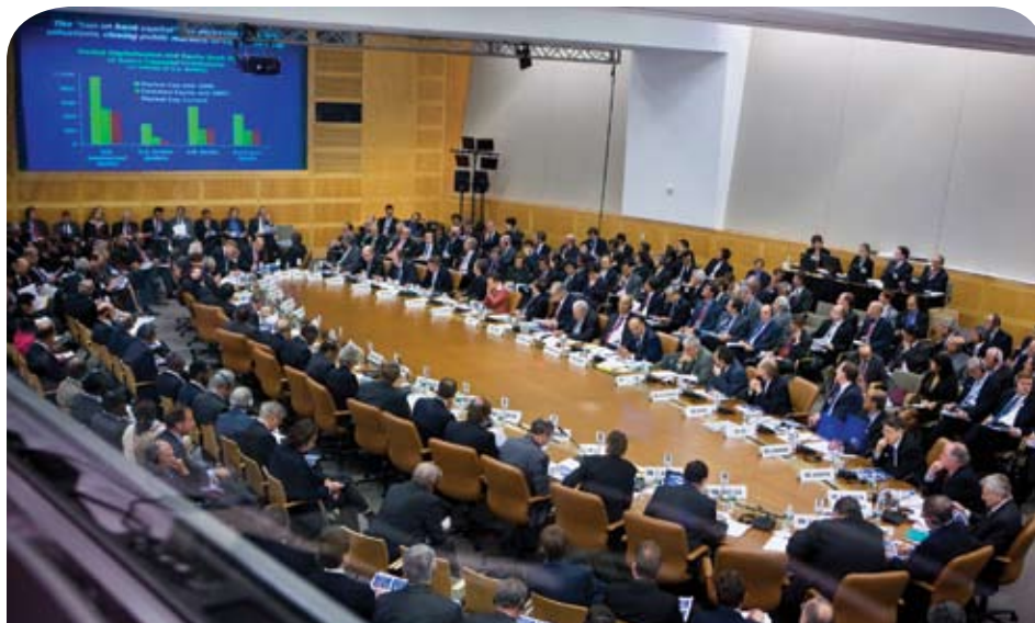
En la reunión del 11 de octubre del CMFI, las autoridades financieras mundiales avalaron un plan de acción para luchar contra la crisis internacional.

En la adopción de estas medidas debe asegurarse la protección de los contribuyentes y evitarse efectos potencialmente adversos